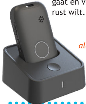
Mobiel alarmapparaat in oplader

U draagt een mobiele zender die in huis en buitenshuis werkt. Als u alarmeert ziet de alarmcentrale waar u bent en neemt direct contact met u op. Dit abonnement past bij u wanneer u graag zelfstandig op pad gaat én veiligheid en rust wilt.