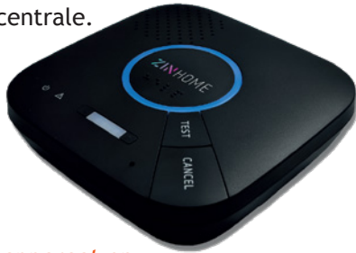
Alarmapparaat en armband met zender

Dit abonnement werkt binnenshuis en direct rond uw huis. U heeft een alarmknop om uw hals of pols. Bij een druk op de knop belt uw personenalarmering direct met de alarmcentrale.