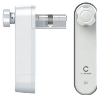
Elektronische cilinder aan de binnenzijde van uw voordeur