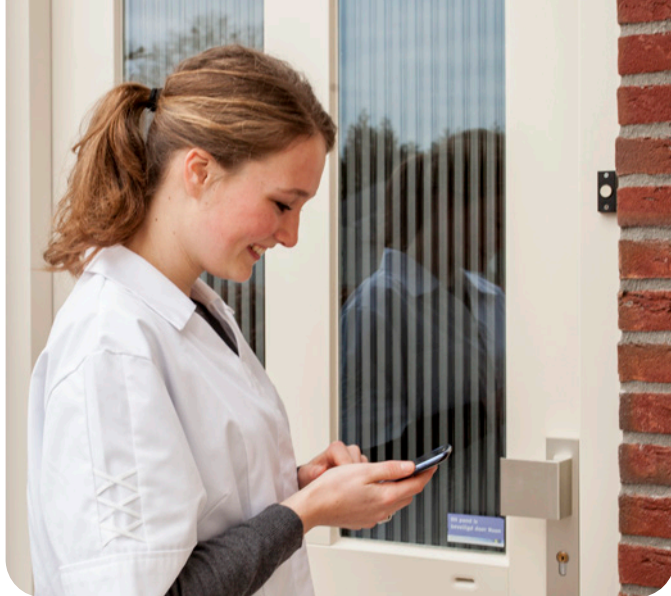
Uw deur openen met een app op de smartphone